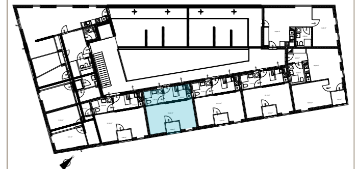
Übersicht Obergeschoss 3