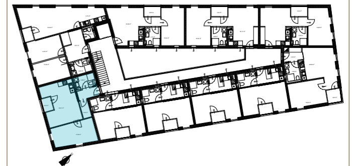
Übersicht Obergeschoss 2